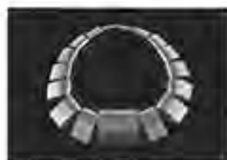
黒木直子 / 中村直志 Kuroki