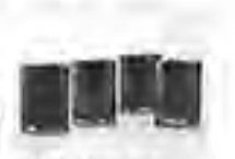
黒木直子 / 室川 伸志 星の詩