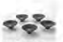
黒木直子 / 菅原 弘浩 入り・目