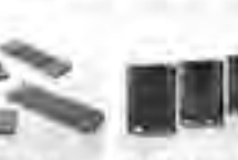
黒木直子 / 橋本 俊哉 つぎま