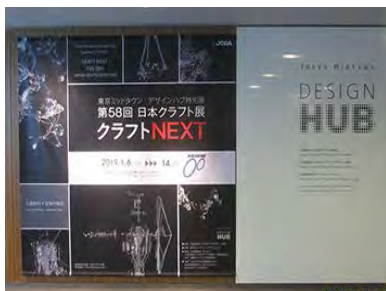
第58回日本クラフト展看板