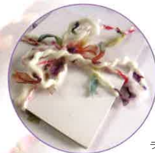
ラッピングリボン