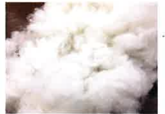
洗われてフワフワになった羊毛