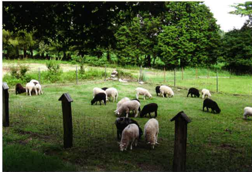
フライングシープ 牧場風景