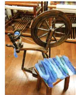
糸紡ぎ車と繊維の方向をそろえた羊毛