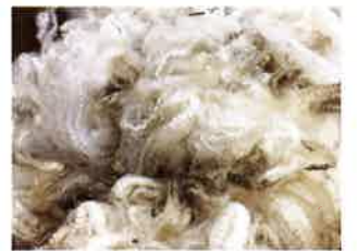
刈り取られた羊毛