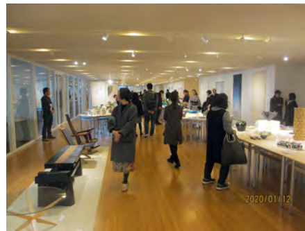
第59回日本クラフト展会場