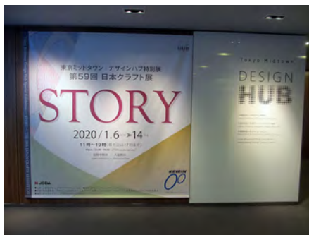
第59回日本クラフト展看板