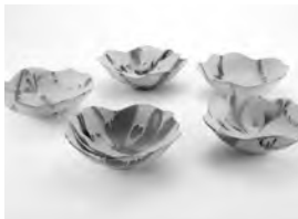
招待審査員賞/唐澤昌宏賞 土居 万里子 「ウェーブボール~ random pattern ~」