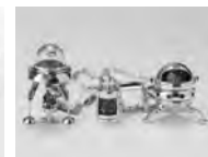
奨励賞/FRANCESC PLANAS CERVELLÓ 「Episodio I, Gran viaje a ITACA "La familia" II, Càpsula de memoria III, Encuentro con la esperanza」