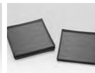
奨励賞/當眞 嗣人 「斑鳩の空、見上げれば」